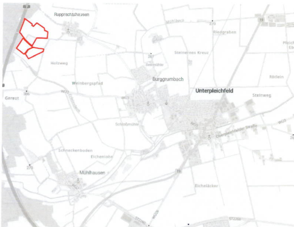
Abb. Lage des Vorhabens (ohne Maßstab)

Im o. g. Geltungsbereich soll ein Sondergebiet ausgewiesen werden. Die Lage und Abgrenzung ist aus dem nachfolgenden Kartenausschnitt ersichtlich (maßstabslos).